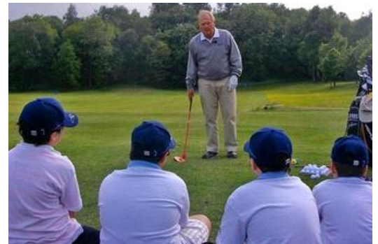
In England this October, Jack Nicklaus explains this more forgiving version of the game, called SNAG.